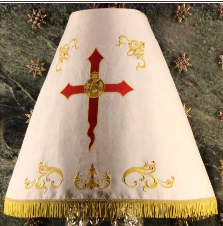
Detalle del Manto

Que Nuestra Señora del Pilar nos de Fortaleza en la Fe, Seguridad en la Esperanza y Constancia en el Amor.