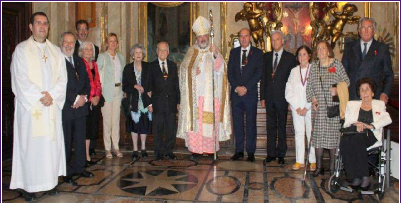
Foto de familia en la Sacristía de la Virgen