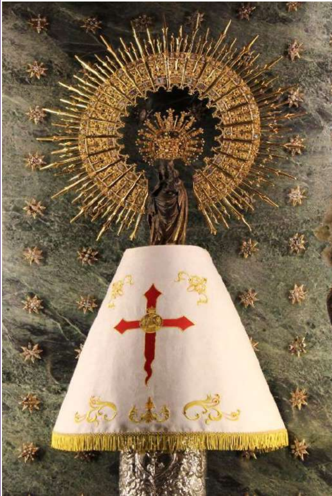
La Virgen del Pilar luce el manto de la RCNPZ