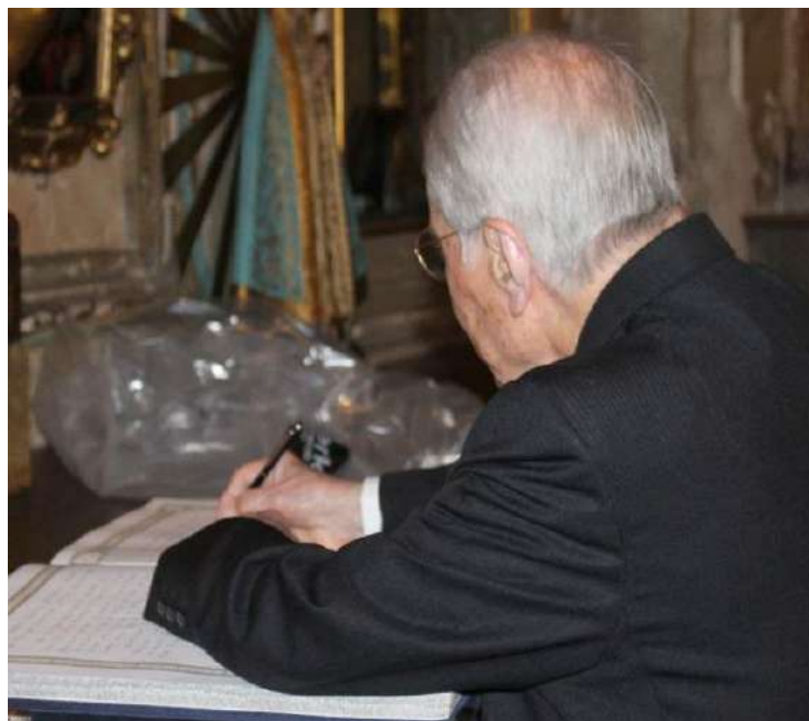
Firma del Hermano Mayor en el Libro de Honor